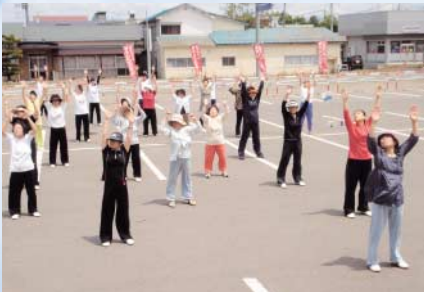
太極拳サークル チャレンジデーで披露