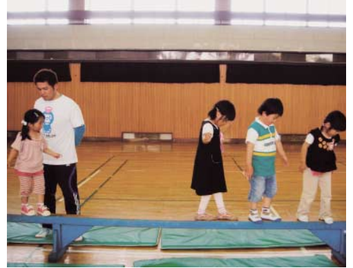
こどもの運動教室 元気っこクラブ