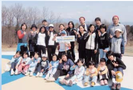
バレーボールJr 町行事参加(高寺山登り)