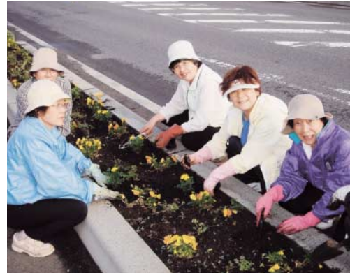
ウォーキングサークル アドプト制度(花壇管理)