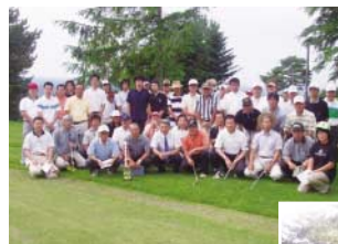
第2回須賀川大森スポーツクラブコトヘ

自分の住む地域を愛し、地域で手をつなぎ子どもたちを見守っていけるような環境を提供し、住民主体の共同体を意識し、スポーツを含めた、文化的な面も取り入れながら、地域の歳時記を次世代に残せるような活動を心がけていかなければならない。又、子どもたちや成年が地域を守っていかなければならないと云う郷土愛を自ら思えるようなクラブづくりを目指していく。更にはスポーツの得意でない子どもや親にもスポーツの場の提供をし、いつでも気軽に体験し生活の中に気軽に取り込めるようになって行ければと考える。